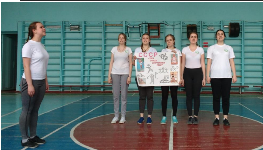
На фото: команда группы 1-2 «СССР»

18.04.17 г. в спортивном зале ГБПОУ РО «ГМК» состоялась эстафета «Мы за здоровый образ жизни!», организованная преподавателями физ.культуры Ю.В. Готовским и Д.С. Захаровым, в которой приняли участие студенты 1 курса групп 1-1,2,3 специальности «Сестринское дело». Три команды «Антидиета», «СССР» (Союз спортивных студентов России) и «Прогресс» состязались в интеллектуальной викторине, где проявили свои знания в области