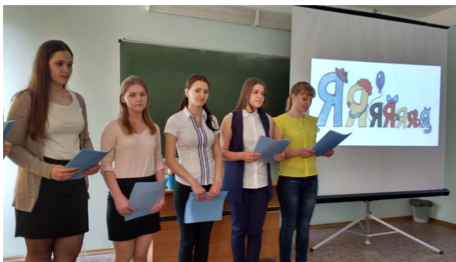
На фото: фрагмент поточного часа