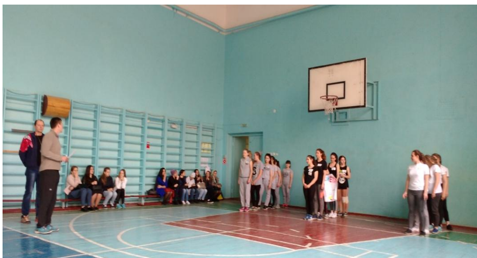
На фото: участники эстафеты группы 1-1, 1-2, 1-3

спортивной терминологии, истории Олимпийских игр, а также в различных спортивных конкурсах с мячом, эстафетной палочкой, обручем и скакалкой, в которых требовалось продемонстрировать быстроту реакции, скорость, выносливость, ловкость и умение работать в команде. Участники и зрители, среди которых были преподаватели и студенты колледжа, получили заряд бодрости и хорошего настроения.