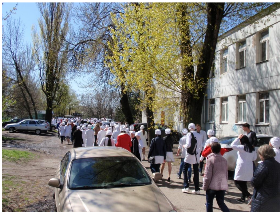
На фото: эвакуация студентов колледжа

Можно ли быть готовым к чрезвычайным ситуациям? Можно и нужно! Безопасность сама по себе не появится, нужны практические тренировки. При хорошей натренированности и четкой координации принимаемых мер можно защититься от последствий любой чрезвычайной ситуации. А вот основным мероприятием при возникновении такой ситуации является эвакуация. Плановая объектовая тренировка с эвакуацией прошла в нашем